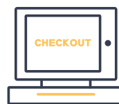
iPad POS 系統